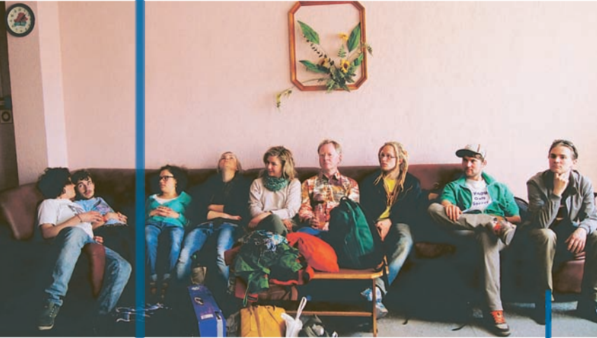
Unsere Reisegruppe/Autoren in unserem Hotel in Gomel, Belarus. Vom 21. bis zum 30.4.2011 waren wir im Land, um uns über die Folgen der Tschernobylkatastrophe zu informieren.