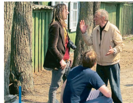
Die alten Menschen in Bartolomeevka machen sich keine Sorge um die extreme Strahlung um sie herum, für sie mache es keinen Unterschied.

500.000 Menschen sind damals aus den verstrahlten Gebieten evakuiert worden oder selbst gegangen. 485 Dörfer sind nun unbewohnt, verbotene Dörfer. Doch rund 1,5 Mio. Menschen leben in Belarus nach wie vor auf radioaktiv strahlenbelastetem Boden. Die Gegend außerhalb von Gomel ist dünn besiedelt. Deutschland z.B. ist acht Mal dichter besiedelt als die verstrahlten Gebiete Weißrusslands. Bei einem vergleichbaren Unfall in Deutschland könnten statt 2 gleich 16 Mio. Menschen betroffen sein.