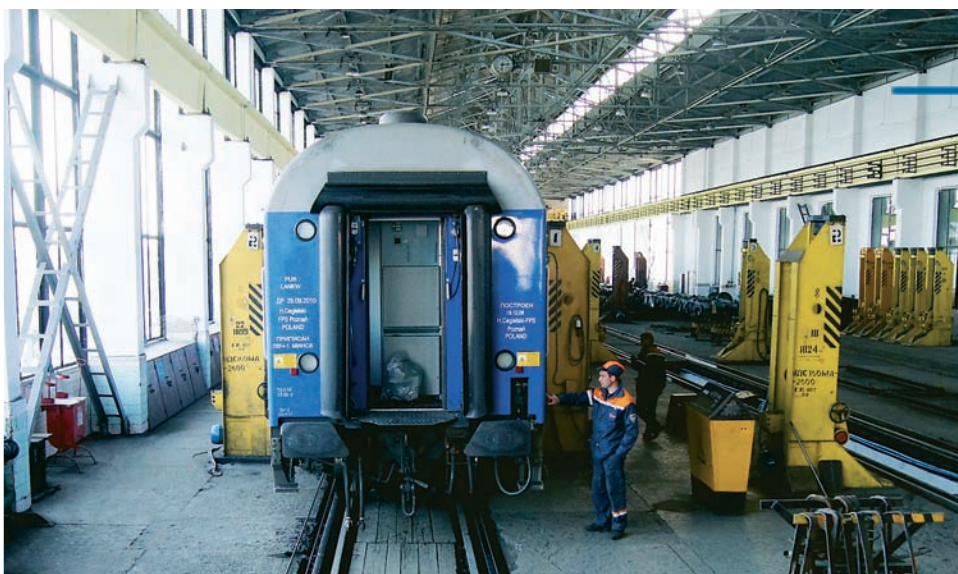
Stellwerk in Brest. Nach der Grenzkontrolle wird der Zug hier Wagon für Wagon angehoben und mit einem neuen Fahrwerk bestückt.