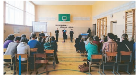
Gedenkfeier in der Turnhalle. Für die Kinder war der ungewohnte ausländische Besuch dann aber doch spannender.

Eigentlich hatte ich keinen Appetit nach den morgendlichen Vorführungen in Sachen Strahlung. Aber hungrig war ich dann doch nach dem Vormittag. Und lecker sah das meiste auch aus. Alles war selbst gemacht, versteht sich.