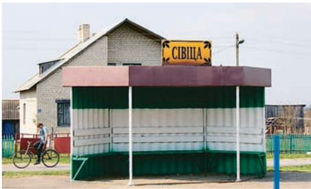
Bushaltestelle in Siviza. Der ländliche Teil von Belarus ist oft wirtschaftlich veraltet und gerade junge Menschen zieht es mehr und mehr in die Städte.

Frühmorgens machten wir uns auf den Weg in das Dorf Siviza, fast auf die Stunde genau 25 Jahre nach der Katastrophe im Reaktor von Tschernobyl.