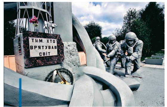
Denkmal für den Einsatz der Rettungskräfte während der Tschernobylkatastrophe

Niemand kennt die genaue Zahl. 600.000 – 800.000, vor allem junge Männer aus der gesamten Sowjetunion, mussten nach der Tschernobylkatastrophe in den verstrahlten Gebieten helfen. Man nennt sie Liquidatoren. Sie hatten die Aufgabe, den Reaktorbrand zu löschen und die Welt vor noch größeren Auswirkungen der Katastrophe zu bewahren. Sie waren es auch, die den Betonschutzmantel bauten und versuchten große Gebiete von der Strahlenbelastung zu säubern, in dem sie Böden abtrugen, Häuser abwuschen und Straßen neu teerten. Rund 50 Prozent der Liquidatoren sind heute Invaliden. Laut den Internationalen Ärzten gegen Atomgefahren (IPPNW) sind 50.000 von ihnen bisher an Strahlenschäden gestorben oder begingen Selbstmord. Zu beobachten ist, dass die Rate der Krebserkrankungen unter den Liquidatoren zurzeit stark ansteigt.